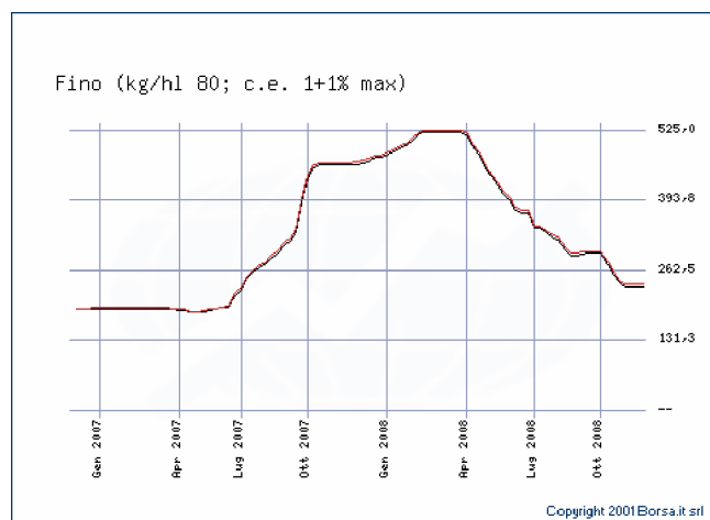
Andamento dei prezzi del frumento duro fino alla Borsa Merci di Bologna (gennaio2007/ novembre 2008).

tante il caso del frumento duro (cfr. grafico successivo), il cui prezzo alla Borsa Merci di Bologna ha superato nel periodo di massima quotazione (marzo 2008) il 140% del prezzo rilevato ad inizio raccolto (giugno 2007). Analogo, anche se non