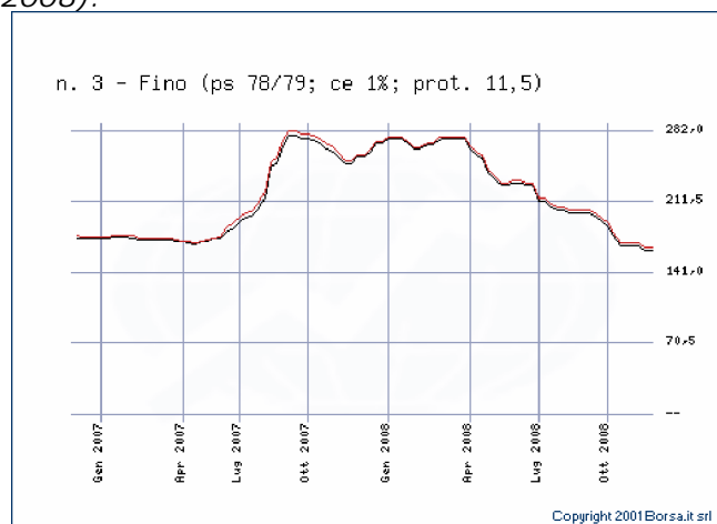
Andamento dei prezzi del frumento tenero N. 3 alla Borsa Merci di Bologna Fino (gennaio2007/ novembre 2008).